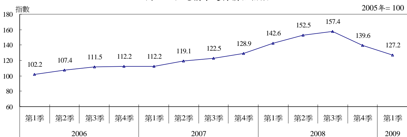
圖二：住宅樓宇建材價格指數