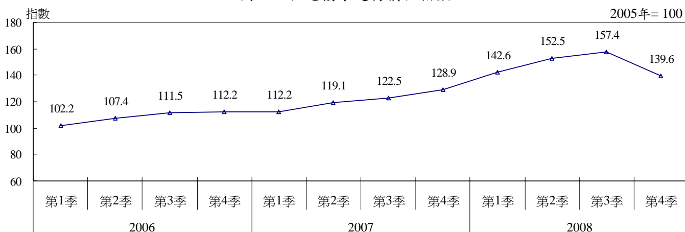
圖二：住宅樓宇建材價格指數