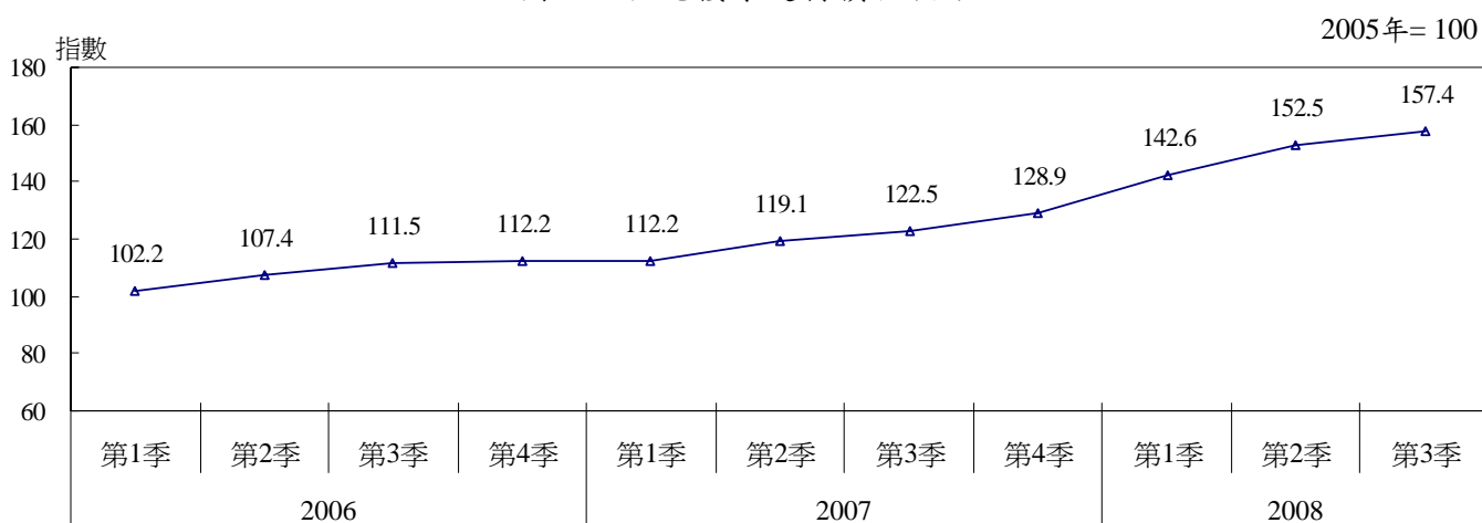
圖二：住宅樓宇建材價格指數