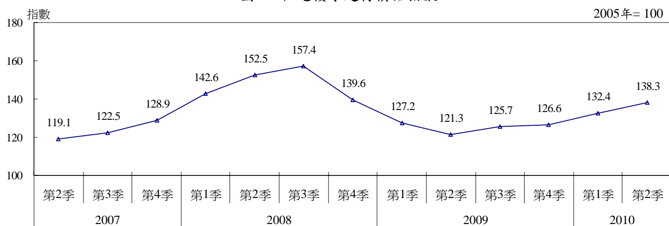
圖2 - 住宅樓宇建材價格指數