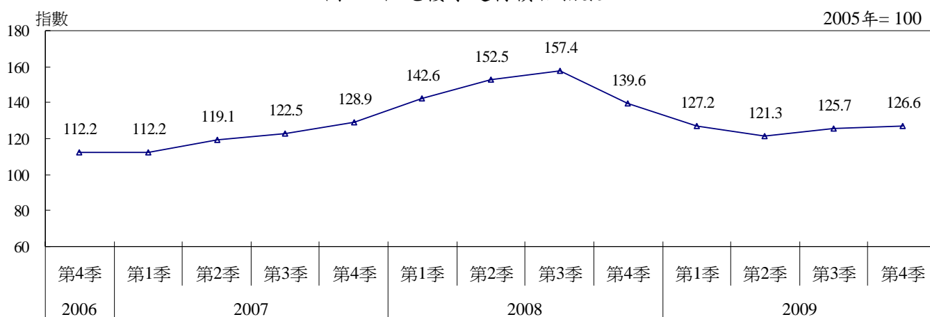
圖2 - 住宅樓宇建材價格指數