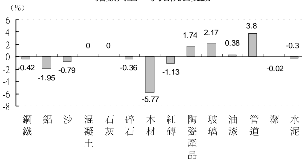
一九九八年第一季度建築材料批發價格 指數與上一季比較之變動

管道的價格指數在一九九八年第一季度出現上升情況，與一九九七年第四季度比較，上升幅度為3.8%，是被調查的建築材料中價格指數上升幅度最高的一組，若與一九九七年同季度比較，則有3.3%的升幅。而反之，木材這項建築材料是一九九八年第一季各項價格指數與上季度比較下跌幅度最大的一組，下跌5.8%。與一九九七年同季度比較，木材為價格指數下降幅度最顯著的一組（-6.8%）。