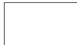
表 三：主要 建築材料 平均 批發 價